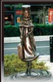
4 メーテルとの出会い