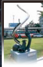
1 星野鉄郎とメーテル