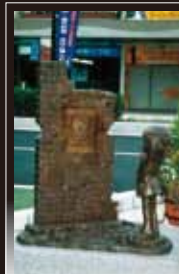
3 少年 星野鉄郎